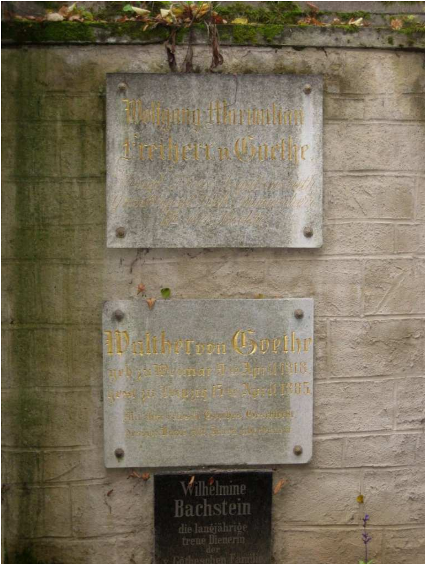
Gedenktafeln an die beiden Enkeln Goethes, Wolfgang und Walther von Goethe.

(Verfasst von Helmut Wurm, Betzdorf. Alle Fotos vom Verfasser)