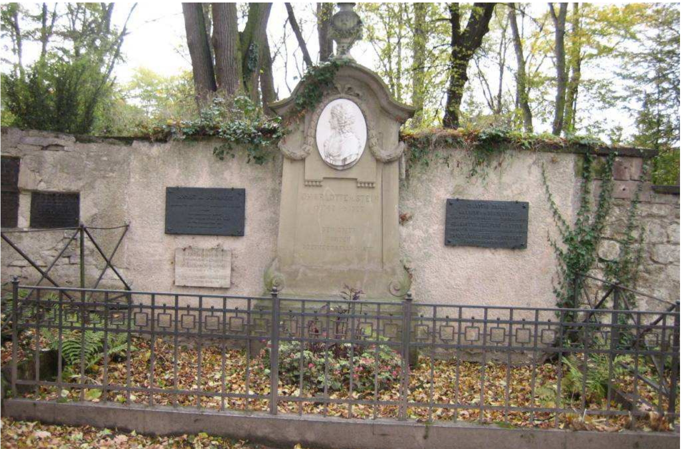
Die Grabstätte der Familie der Frau von Stein. In der Mitte das Bild von Charlotte von Stein, der verehrten Freundin Goethes.