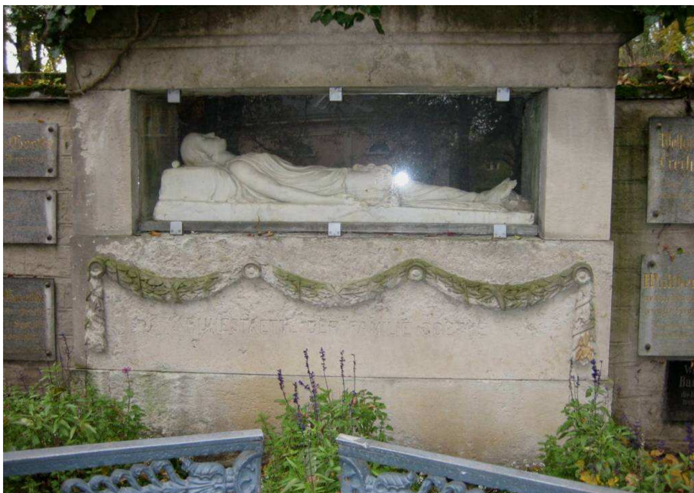
Unter der liegenden Frauen-Plastik steht „Die Ruhestätte der Familie Goethe“.