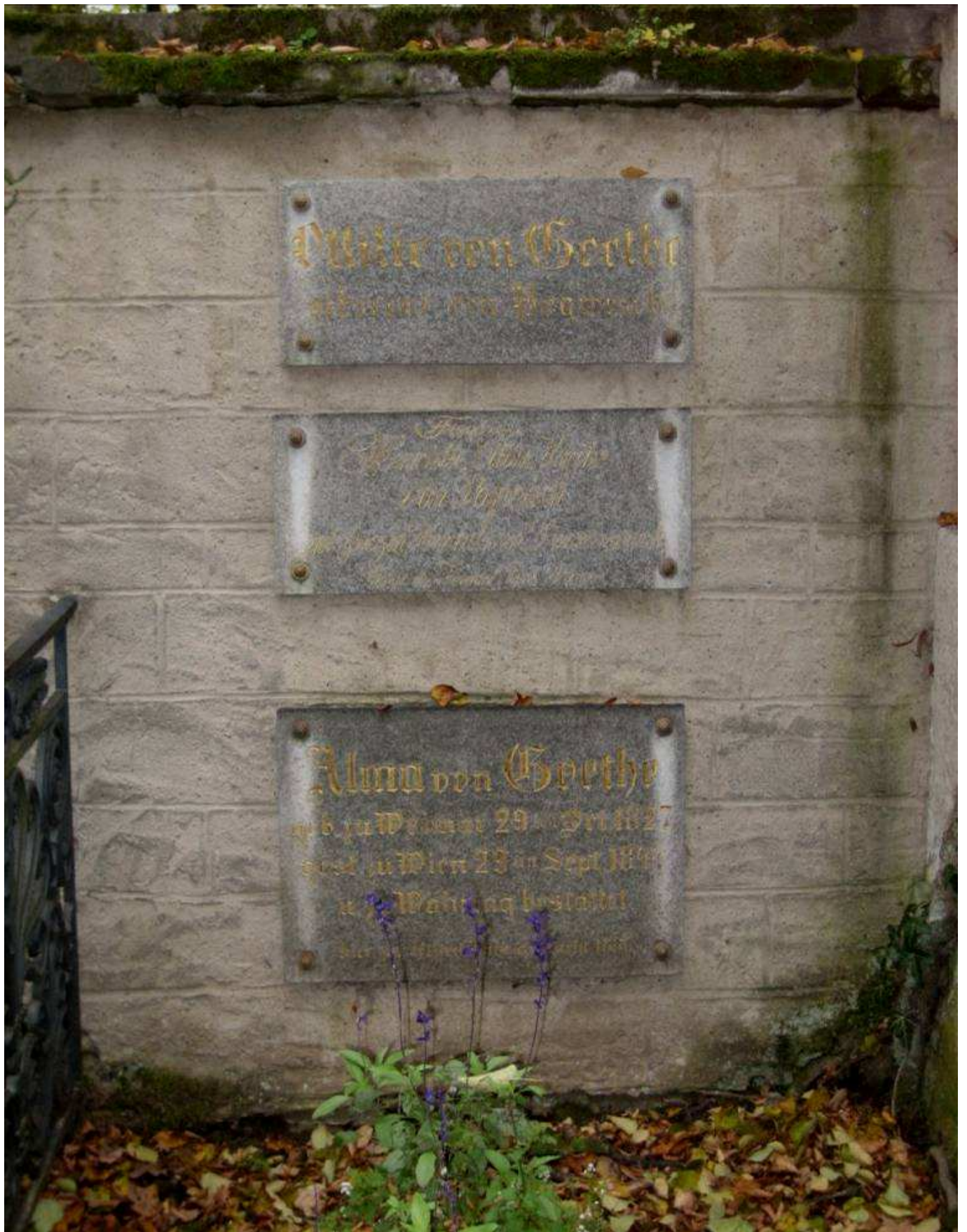
Gedenktafeln an Otilie von Goethe, Goethes Schwiegertochter, und an die früh in Wien verstorbene Enkelin Alma von Goethe.