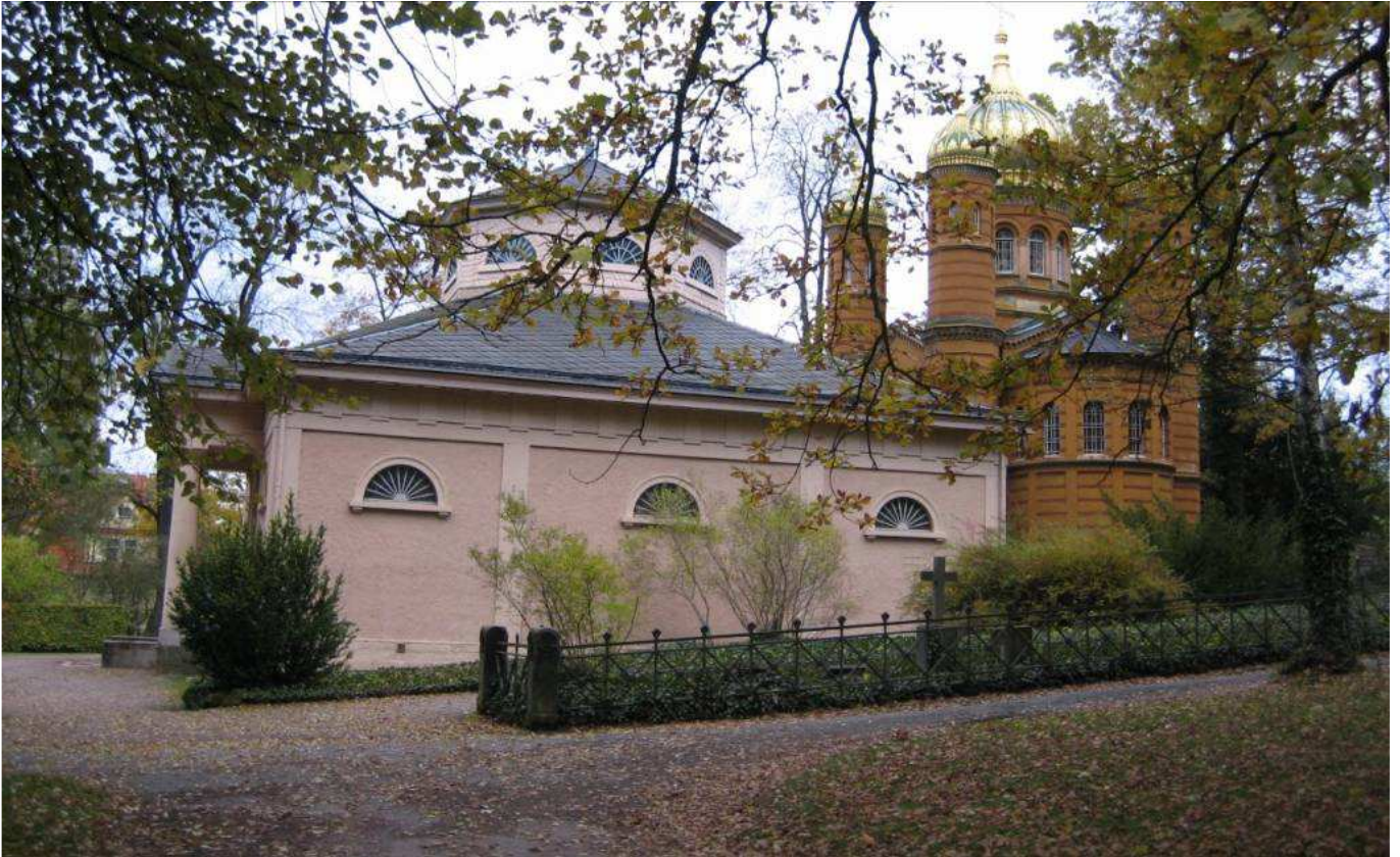
Die Fürstengruft mit Goethegrab und Schillergrab. Im Gruftgewölbe befinden sich die Särge von über 40 Mitgliedern der herzoglichen Familie. Im Hintergrund die russisch-orthodoxe Grabkapelle, errichtet um 1860. Denn die spätere Großherzogin Maria Pawlowna kam aus Russland.