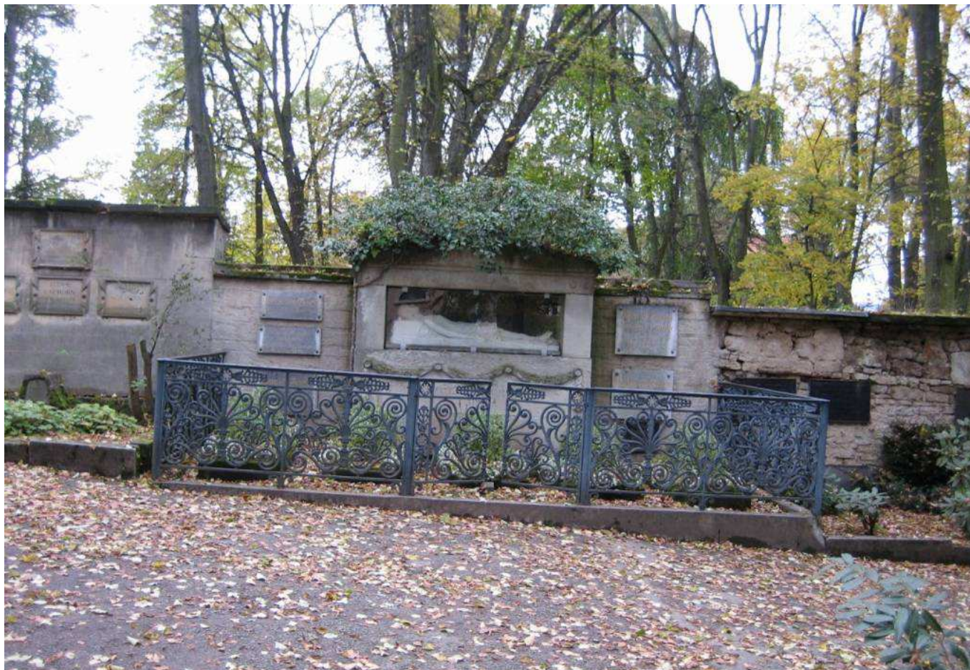
Das Familiengrab der Familie von Goethe mit Teilen der verstorbenen Mitglieder.